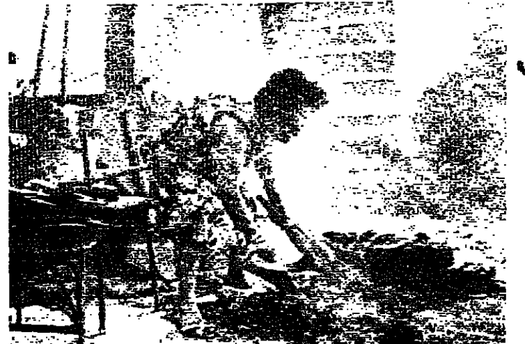
سيدة تتكلم من زملائها للتشور في بيروت الغربية بعد عودتها اليه (رويت)

عقدت اللجنة الامنية اجتماعاً لها في مركزها الدائم في ميدان سباق الخيل في العاشرة من صباح امس، في حضور الضميريين الجزائريين العقيد جمعة رمضان والمقدم شريف فضل، مندوب قيادة الجيش المقدم ميشال لحود ومندوب الحزب التقدمي الاشتراكي السيد سعيد الضوي. وقد تعيّن على الاجتماع المقدم حسن فواز ومندوب حركة أمل السيد احمد العليكي. ولقد تمّ تصديق مقربة من الاجتماعيين في النقاش في هذه اللجنة تركيز على بنود طروحات الفصل على النحو التالي: